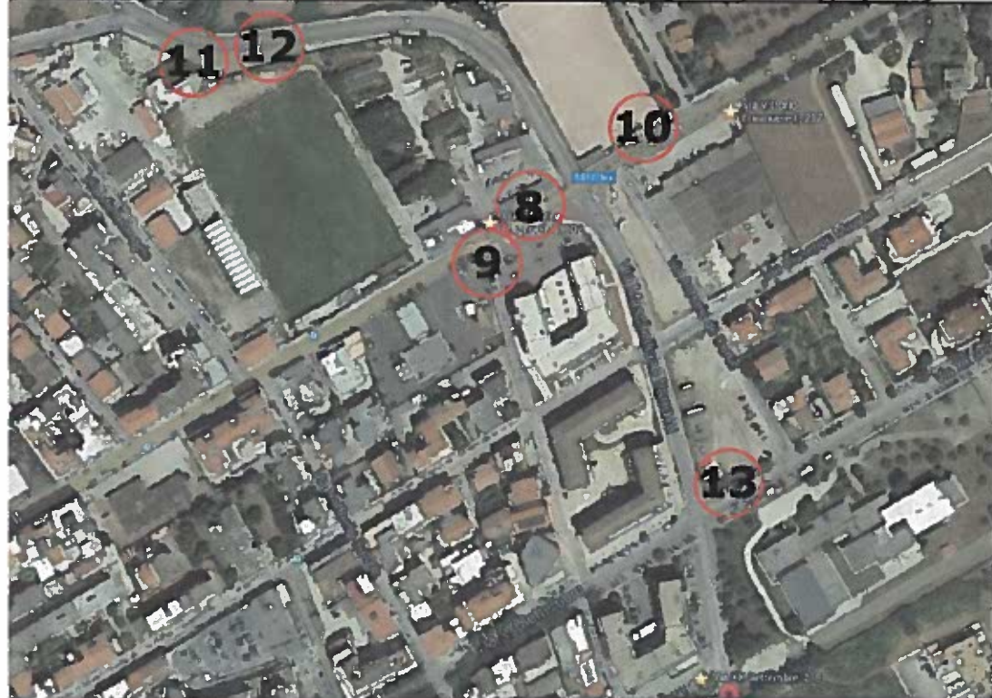
VISTA DAI SATELLITE