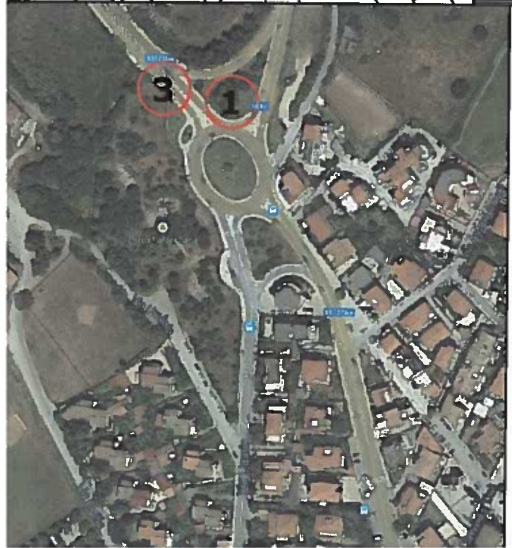
VISTA DAL SATELLITE