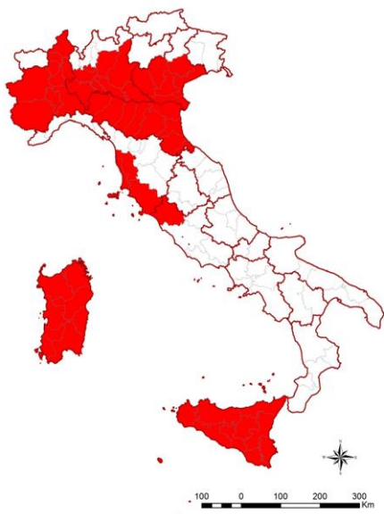
Figura 1. Aree classificate come endemiche (in rosso) per il virus della West Nile

B Resto del territorio nazionale. In queste aree le attività di sorveglianza prevedono il monitoraggio sierologico a campione su sieri di cavalli per rilevare la presenza di IgM, utili all'identificazione di una