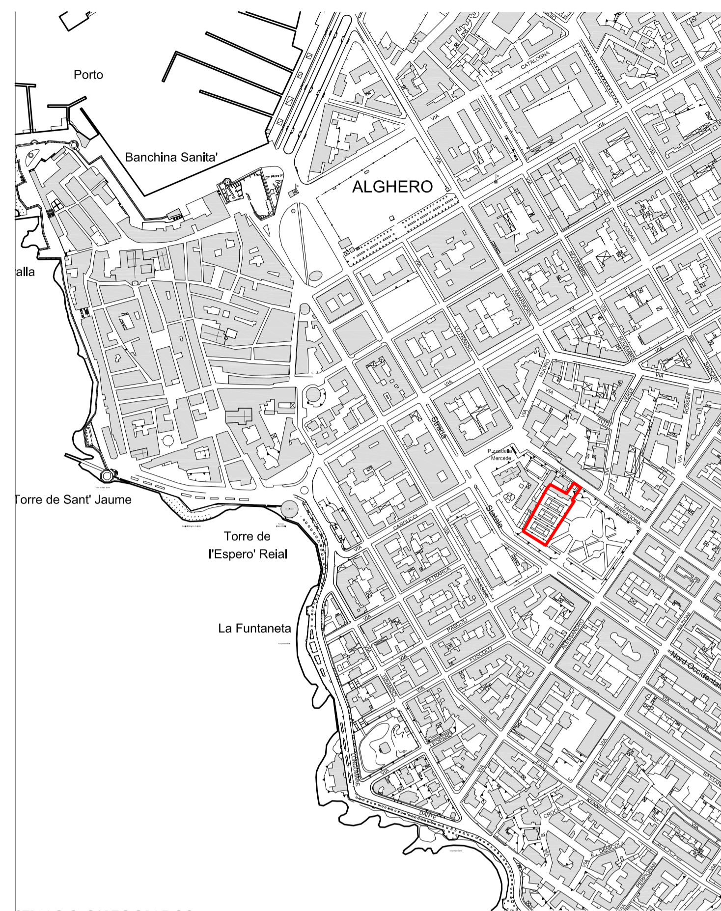
STRALCIO CARTOGRAFICO scala 1_5000