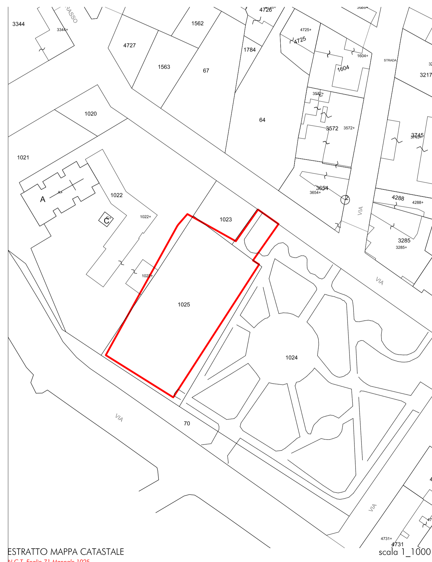
ESTRATTO MAPPA CATASTALE scala 1_1000 N.C.T. Foglio 71 Mappale 1025