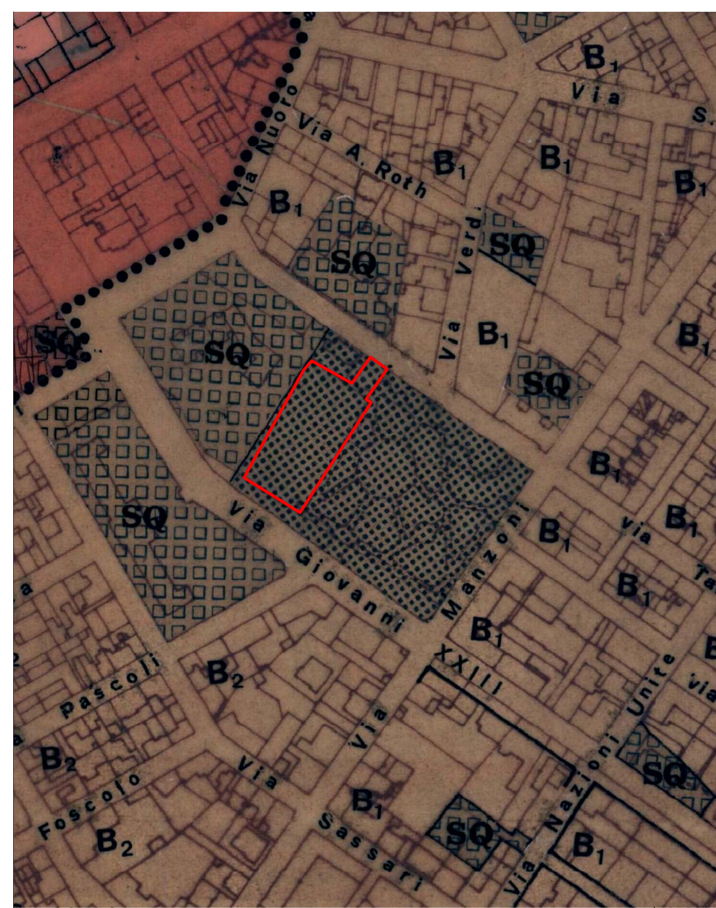
STRALCIO P.R.G. scala 1_2000 Art. 43 - Sottozona S1: Giardini e verde pubblico attrezzato