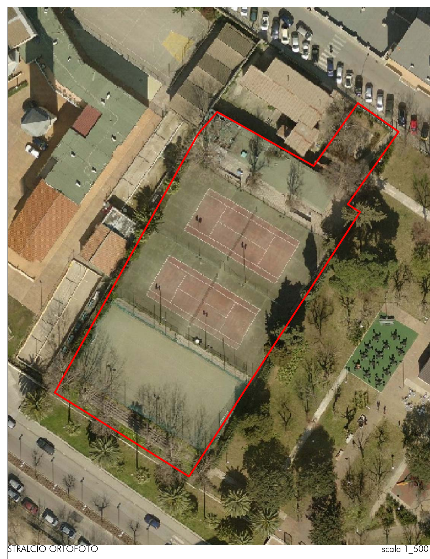
STRALCIO ORTOFOTO scala 1_500