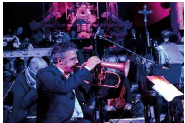
• Lavorazione del Corallo – Allestimenti in città – Cap d'any 2018 – JazzAlguer