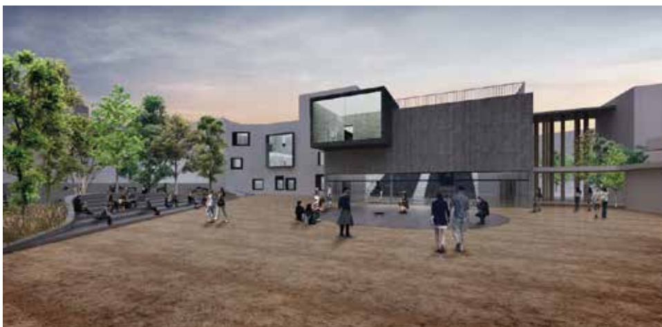
• La Scuola del Nuovo Millennio in via Tarragona

3,1mln per il Centro di aggregazione polifunzionale nel quartiere di Sant'Agostino. Consegna lavori per il Micronido alla Pietraia, disponibili 460 mila euro.