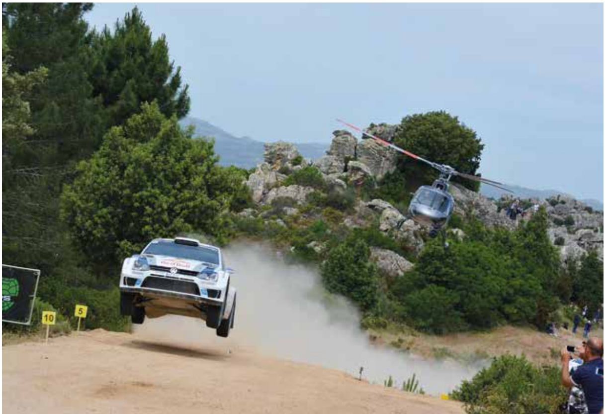
• 100 Giro d'Italia – Il Rally, Campionato Mondiale