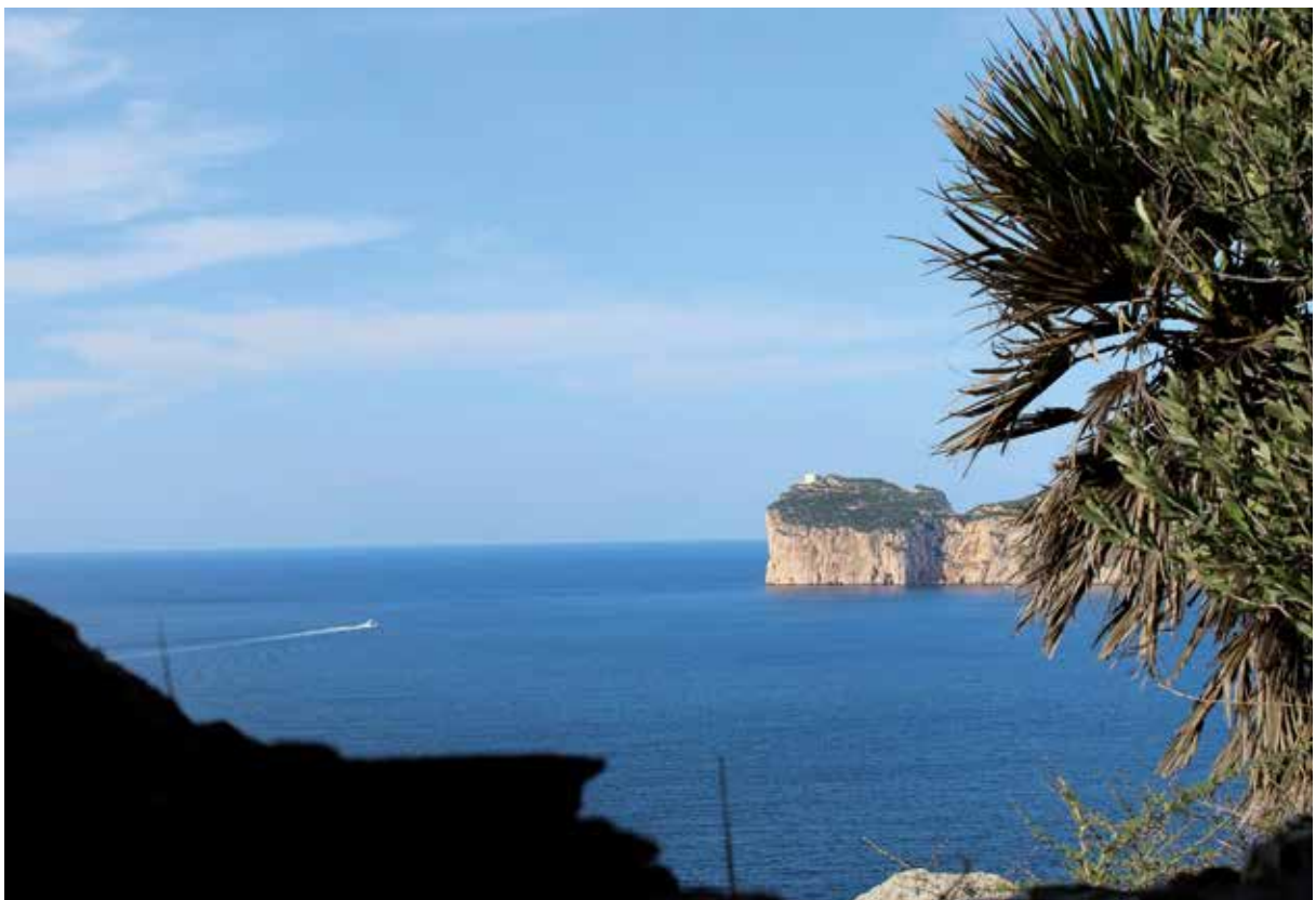
• Decoro in città – Vedute del Parco di Porto Conte, Area Marina