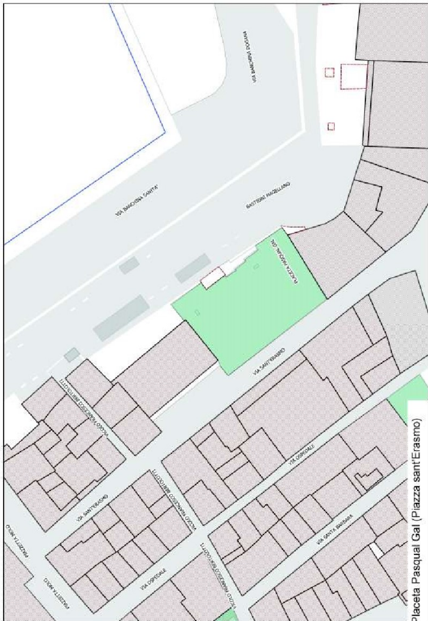
Placeta Pasqual Gal (Piazza sant'Erasmo)