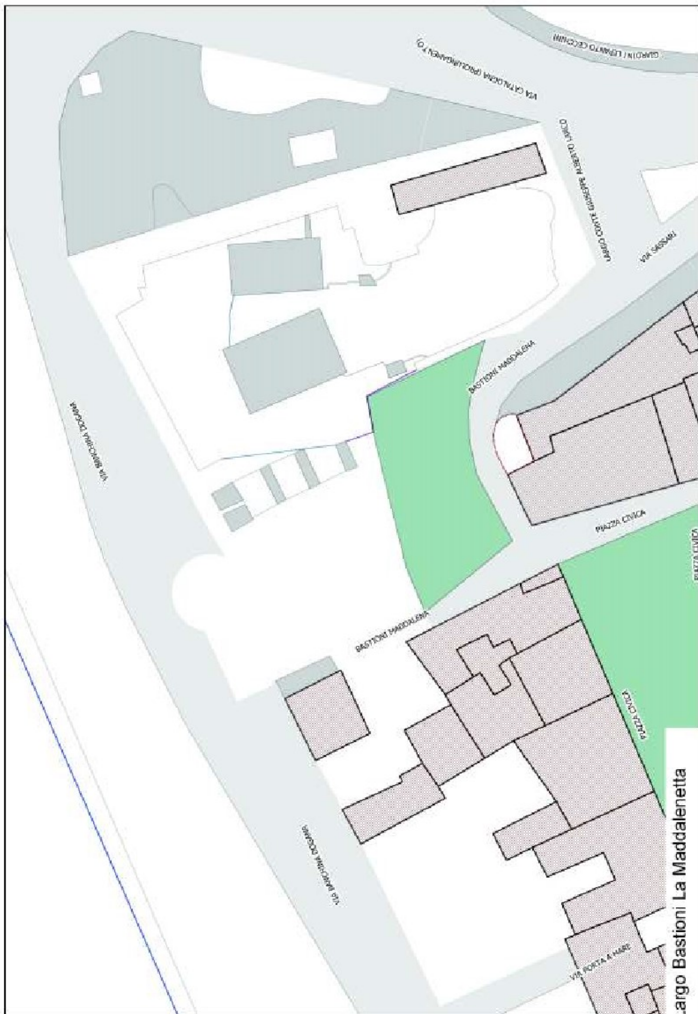
Largo Bastioni La Maddalenetta