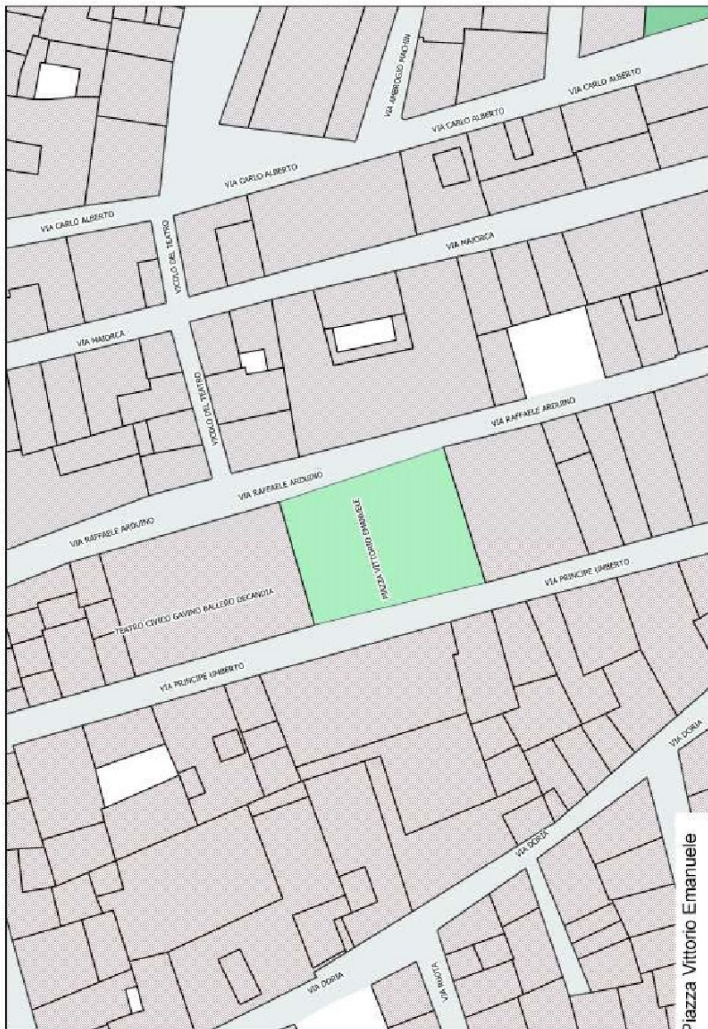
Piazza Vittorio Emanuele