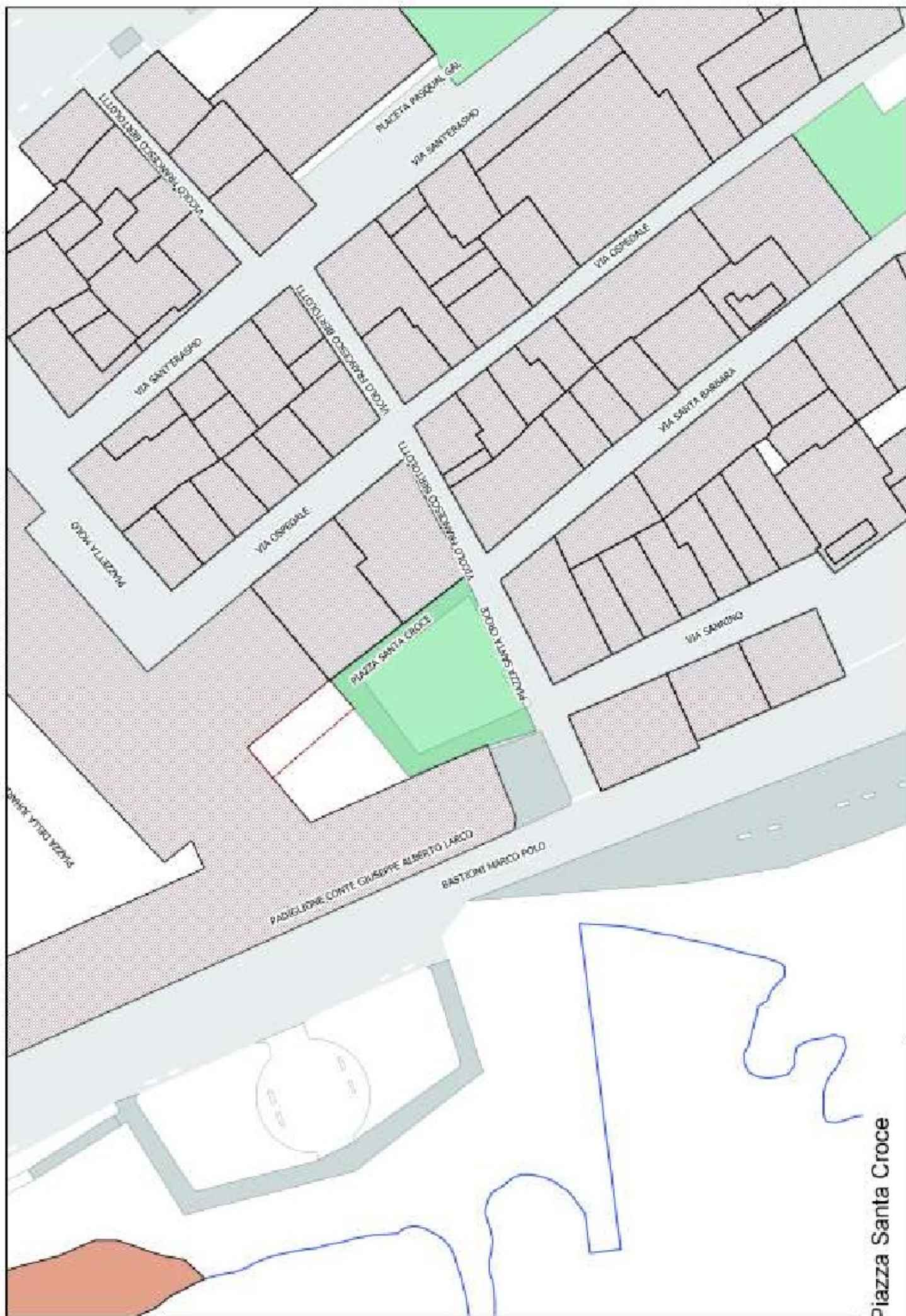
Piazza Santa Croce